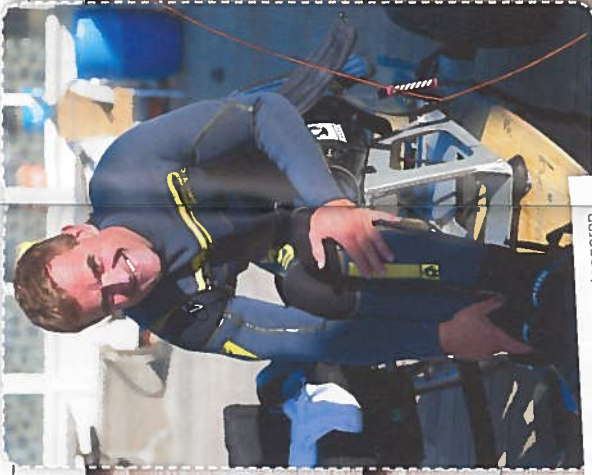
... en dan zichzelf stevig vastsnoren.