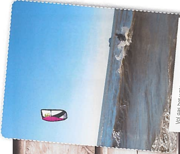
Vol gas het water over!