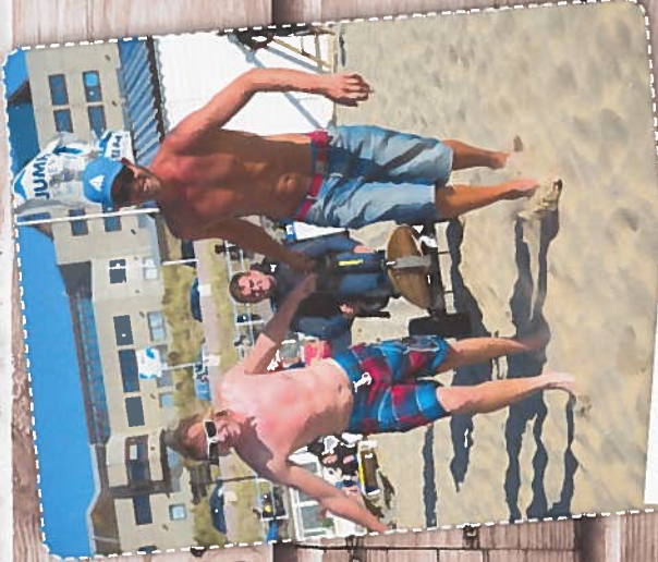
Dan is het tijd om naar zee gereden te worden!

“Het is altijd mijn passie geweest: sporten in de natuur. Na mijn ongeluk dacht ik even dat dit voorbij zou zijn. Maar niets is minder waar, al is dan het kitesurfen ben, voel ik me even weer net zo vrij en zelfstandig als vroeger. Dan waait mijn handicap uit mijn hoofd en ben één met de wind, de zee, de golven. Wanneer ik aan land spoel, volgt de klap. Want dan heb ik hulp nodig om weer bij de club te komen. Hoewel ik