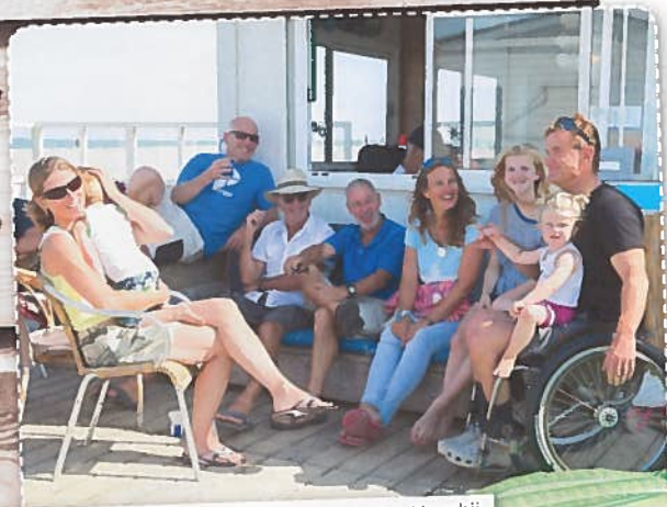
Na aftoop gezellig samen relaxen met een drankje erbij.

sporten. Dat hoefden ze mij geen twee keer te zeggen. Ik heb als zeiler verschillende keren meegedaan aan de Paralympische Spelen en heb veel prijzen gewonnen. Anderen vinden dat geweldig, mij ging het vooral om het zeilen zelf. Zo gaat dat ook bij bergbeklimmen: je succes, dat beleef je alleen.”