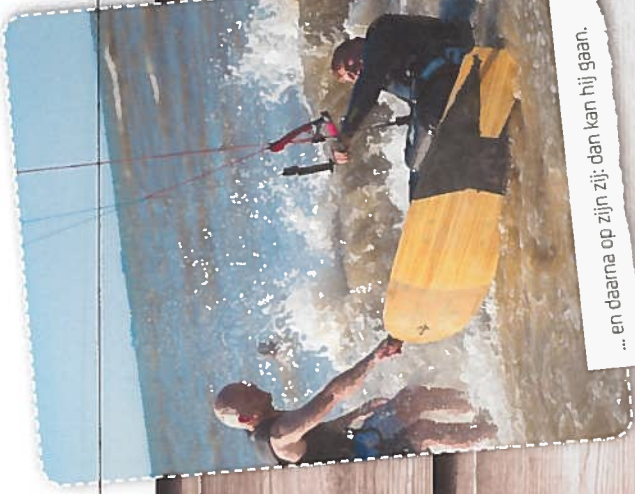
... en daarna op zijn zij: dan kan hij gaan.