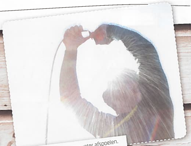
Na het kiten even het zoute water afspoelen.